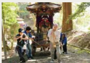
京丹波町商工会長賞 「あともう少し」