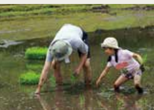
京丹波町教育長賞 「初めての田植え」