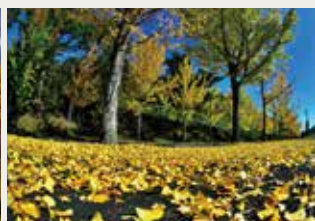
京都府観光連盟会長賞 「さらびきの秋」