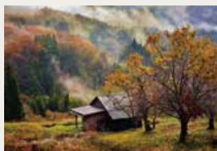
京丹波町観光協会長賞 「朝霧の京丹波晩秋」