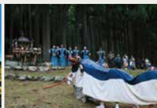
京都新聞賞 「山里の秋祭り」