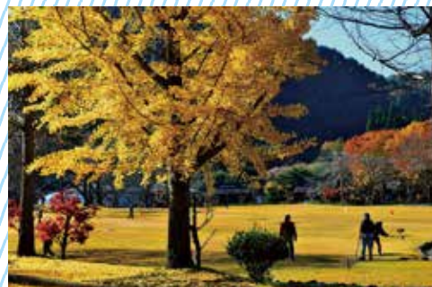
京都府観光連盟会長賞「秋日和」