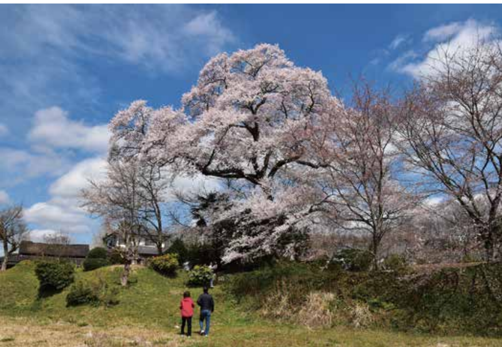
第9回 特選 京丹波町長賞「心の癒やし桜」

行ってみたくなるような 京丹波町の魅力を表現した写真、 京丹波町の観光PRとなる 写真を募集します。