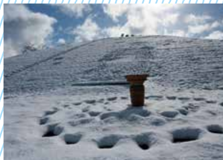
京丹波町観光協会会長賞「雪化粧」