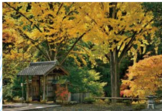
京丹波町教育長賞「錦秋の廣昌寺」