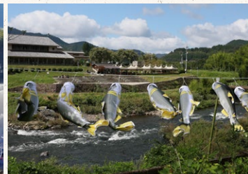
京丹波町教育長賞「由良川に鮎泳ぐ」