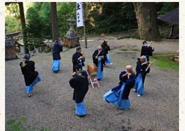
京都新聞賞「田楽踊り」