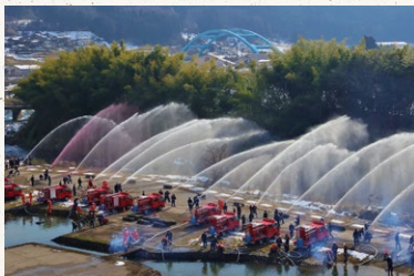
京丹波町商工会会長賞「みんなで守ろう京丹波」