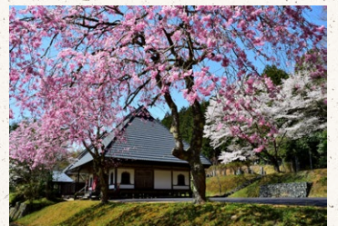
京都府観光連盟会長賞「無動寺春爛漫」