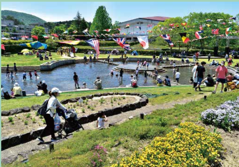
第11回 特選 京丹波町長賞「お出かけ日和」