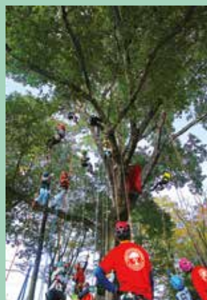
京丹波町教育長賞 「ツリークライミングは気持ちいい」