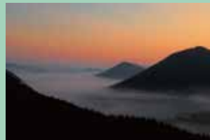
京丹波町商工会長賞「秋告ぐ雲海」