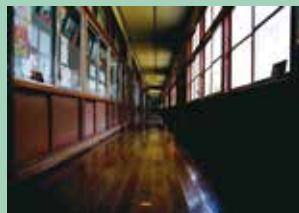
京都新聞賞「懐かしき学舎」