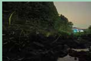
京都府観光連協会会長賞 「蛸舞う須知川」