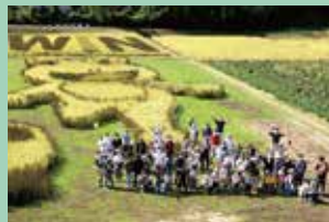
京丹波町観光協会会長賞 「あっぱれ田んぼ」