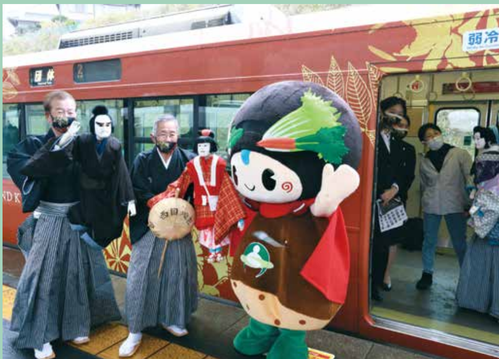
第11回 特選 京都府知事賞「森の京都を歓迎」

[応募期間] 令和6年1月7日(日)から2月3日(土)まで 行ってみたいくなるような京丹波町の魅力を表現した写真、京丹波町の観光PRとなる写真を募集します。