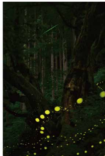
京丹波町観光協会会長賞「七色の木とヒメ蛍」

後援：京都府 京丹波町 京丹波町教育委員会 京丹波町商工会 (公社) 京都府観光連盟 京都新聞