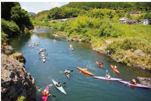
京丹波町教育長賞「京丹波に残すべき文化」