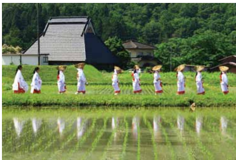
京丹波町商工会長賞「早乙女行列」