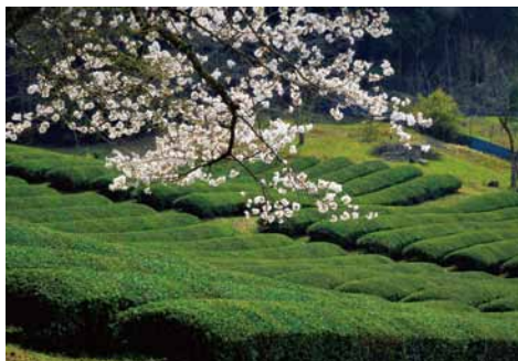
京都府観光連盟会長賞「春の茶畑」